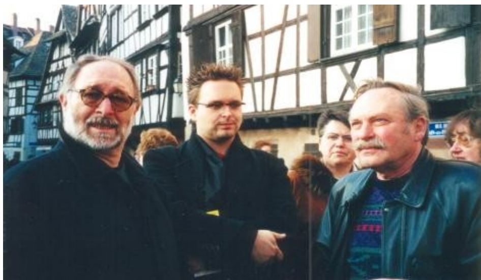
Das Europäische Seifenkisten Derby e.V.

Alle ESKD-Vorstandsmitglieder (die Kassenprüfer mit eingeschlossen) sind beitragsfrei, haben aber trotzdem je 1 Stimme.