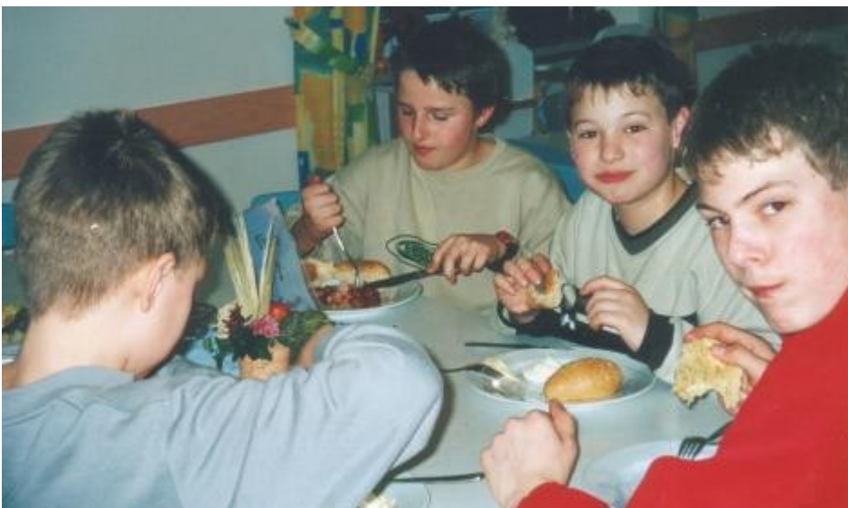
Die Arbeit hat hungrig gemacht