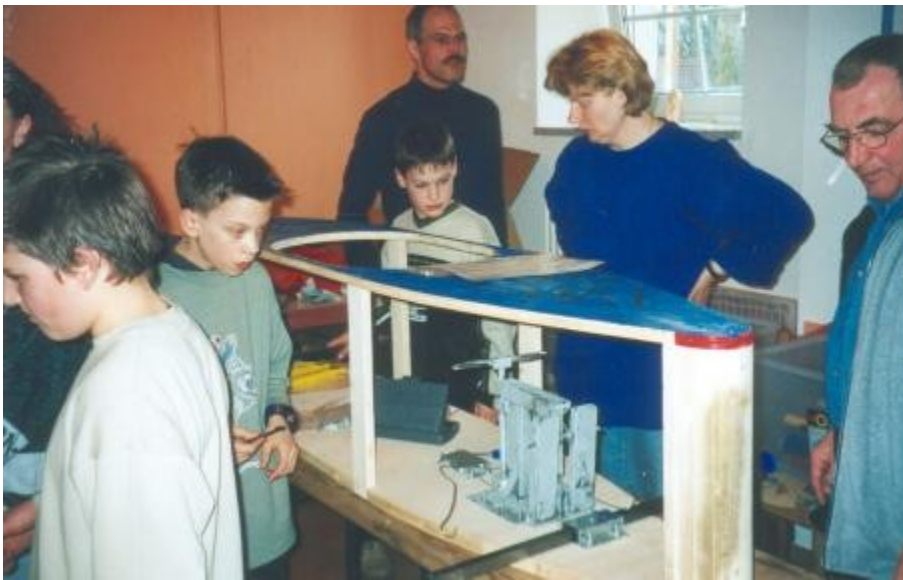
Immer noch Zweifel an der eigenen Fähigkeit???