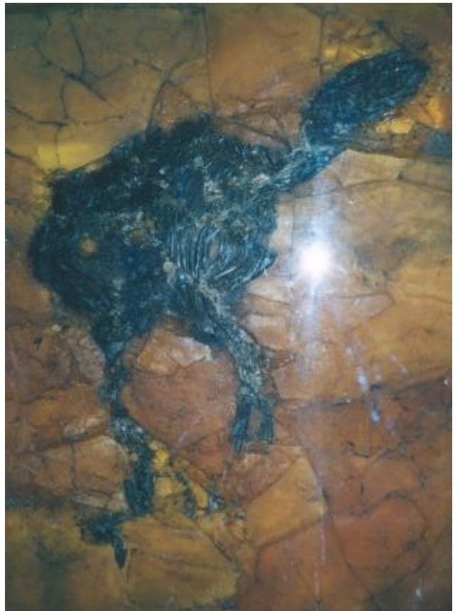
Das Eckfelder Urfpferdchen