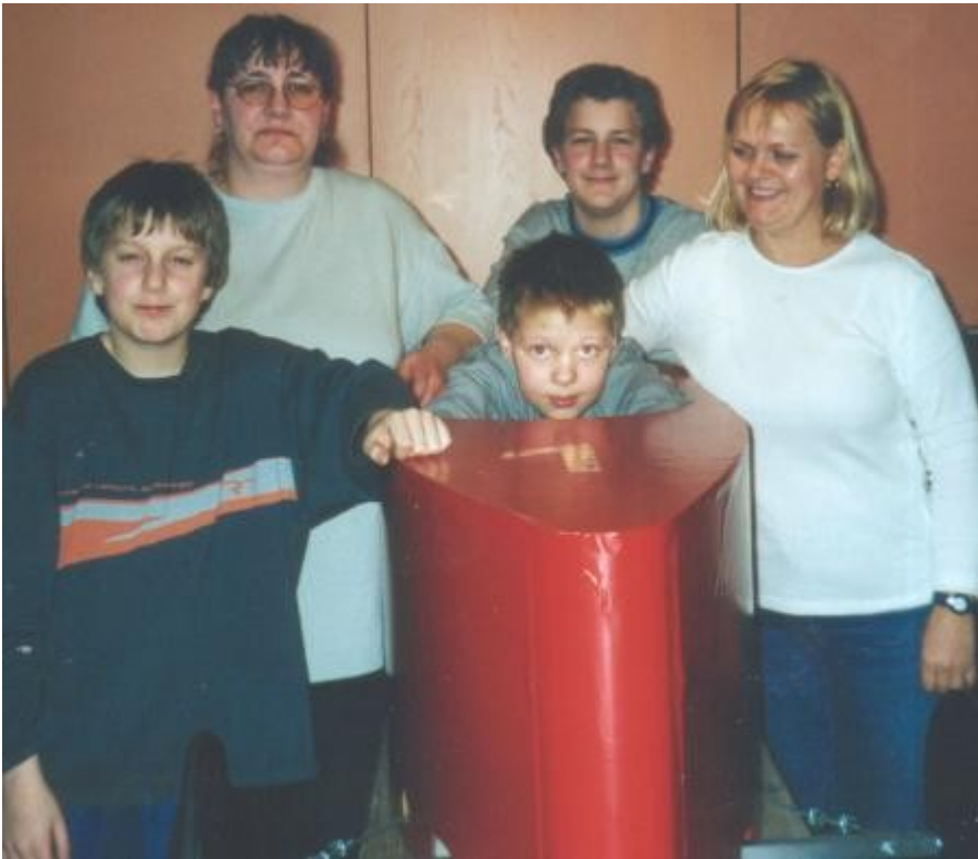
Auch die JUNIOR-Seifenkiste des Teams Rehm - Giles ist bereits fertig