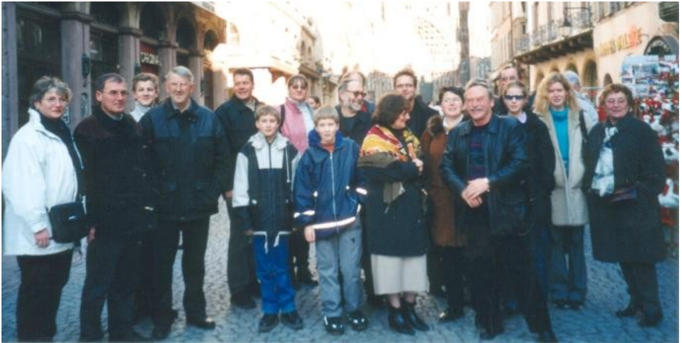
Die Delegation des Europäischen Seifenkisten Derby vor dem Straßburger Münster

Einige Fotos vom Klüsserather Passionsspiel 2000, bei dem auch viele SKK-Mitglieder in biblische Rollen schlüpften